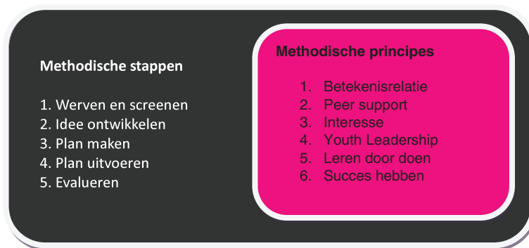
Figuur 2: Methodiek Youth Organizing

uitgangspunten. Dit zijn namelijk de uitgangspunten die ten grondslag liggen aan het methodisch handelen van de sociale professionals in contact met doelgroep. De reden om het handelen te vangen in uitgangspunten (in plaats van in interventies of in richtlijnen) is dat het jongerenwerk zeer dynamisch is: het verschilt per situatie wat nodig is en het verschilt per jongerenwerker hoe een bepaalde handeling vorm krijgt (Metz, 2016; Metz & Sonneveld, 2012). De methodiek Youth Organizing kenmerkt zich door een vijftal methodische stappen en zes methodische principes. De vijf methodische stappen verwijzen naar de volgordelijkheid van handelen. De methodische principes geven inhoudelijk invulling aan het contact dat jongerenwerkers hebben met jongeren. Onderstaande figuur (2) vat de methode samen: